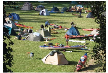
Fußballplatz als Zeltwiese.

Meine Tour begann in Wien . Gleichzeitig mit den Paddlern auf dem Wasser kam ich auf dem Land in Wien an. Sonnenverbrannt und durchtrainiert sahen sie aus. Seit Ingolstadt hatten sie nur schönstes Wetter und Hitze genossen und hatten außerdem sie einen Erlebnisvorsprung von zwei Wochen. Nach der