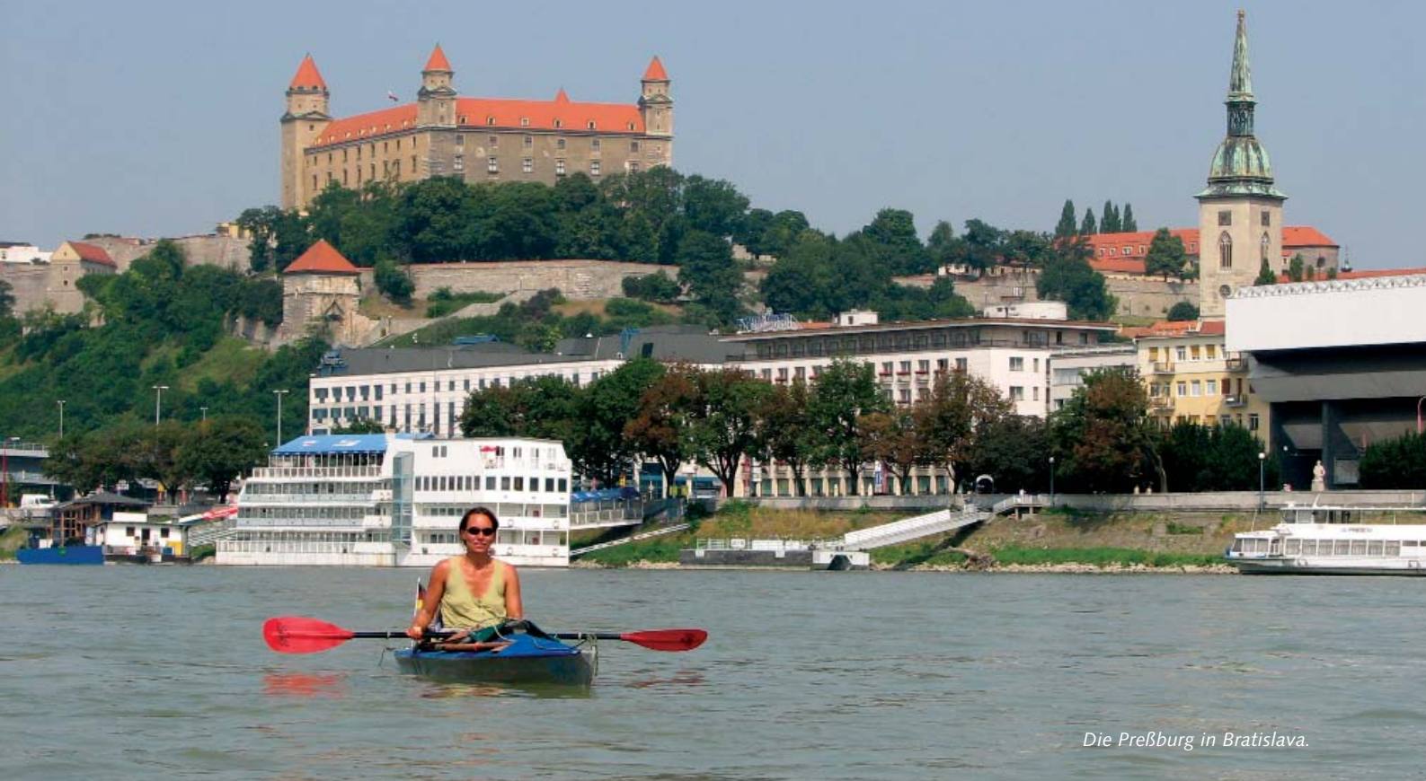
Die Preßburg in Bratislava.

rer. Johann von den Naturfreunden Hainburg führte uns zum Heurigen und zeigte uns mit einem kurzen Rundgang seine Heimatstadt. Früher war die TID drei Tage lang in Hainburg, um alle Sehenswürdigkeiten ansehen zu können. Neben der mittelalterlichen Wehranlage auf dem Schlossberg und den Donauauen gab es eine fast noch intakte Stadtmauer. Nur die alte Tabakfabrik, ein langgezogenes gelbes Gebäude an der Donau (aha!) durchbrach die Mauer.