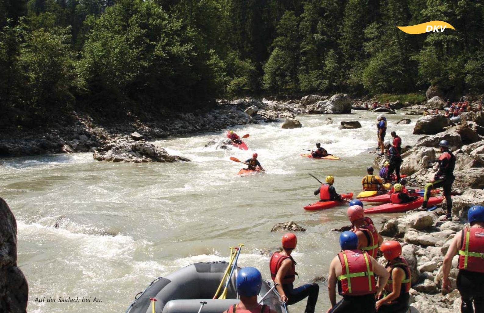
Auf der Saalach bei Au.