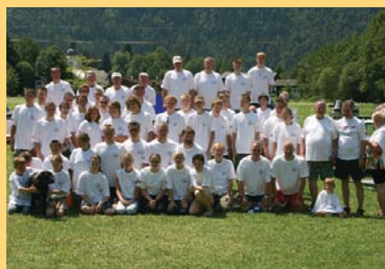
Gruppenfoto der Teilnehmer.

Vorträge zur Ersten Hilfe, zum ökologischen Verhalten auf und am Gewässer,