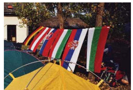
Eine etwas andere Wäscheleine.